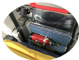
車内 非常扉開閉レバー